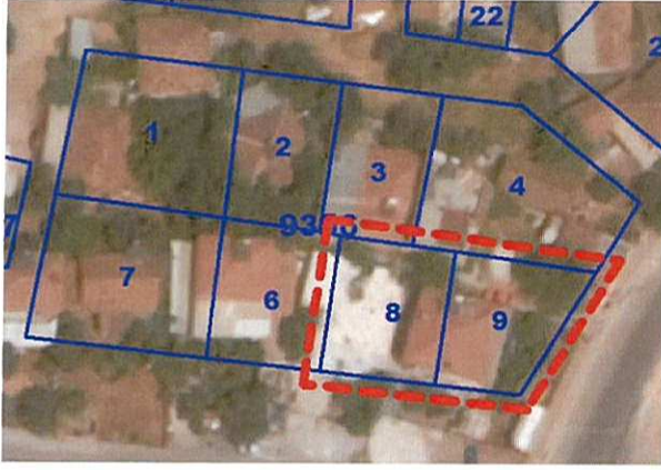
Resim 1: Uydu Fotoğrafi (2013)

Plan değişikliğine konu alan; Antalya İli, Kepez İlçesi, Fevzi Çakmak Mahallesi, O25-A-10-A-1-A ve O25-A-10-A-1-D nolu 1/1000 ölçekli uygulama imar planı paftalarında yer konut parsellerini kapsamaktadır (Bkz: Resim 1 ve 2).