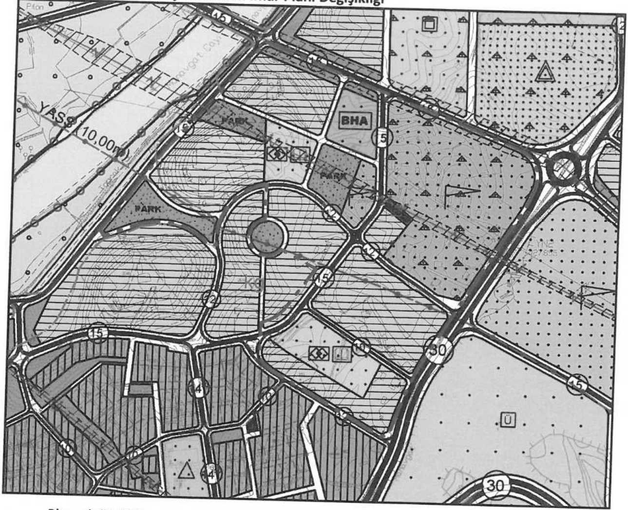
Şekil 3: Öneri 1/5000 Ölçekli Nazım İmar Planı Değişikliği

Plan değişikliği, raporu ve plan hükümleri ile bir bütün olarak hazırlanmıştır. Plan değişikliğine konu alanda onaylı 1/5000 ölçekli "Manavgat (Antalya) 1. Etap (Merkez Bölgesi) İlave+Revizyon Nazım İmar Planı" plan notları geçerlidir.