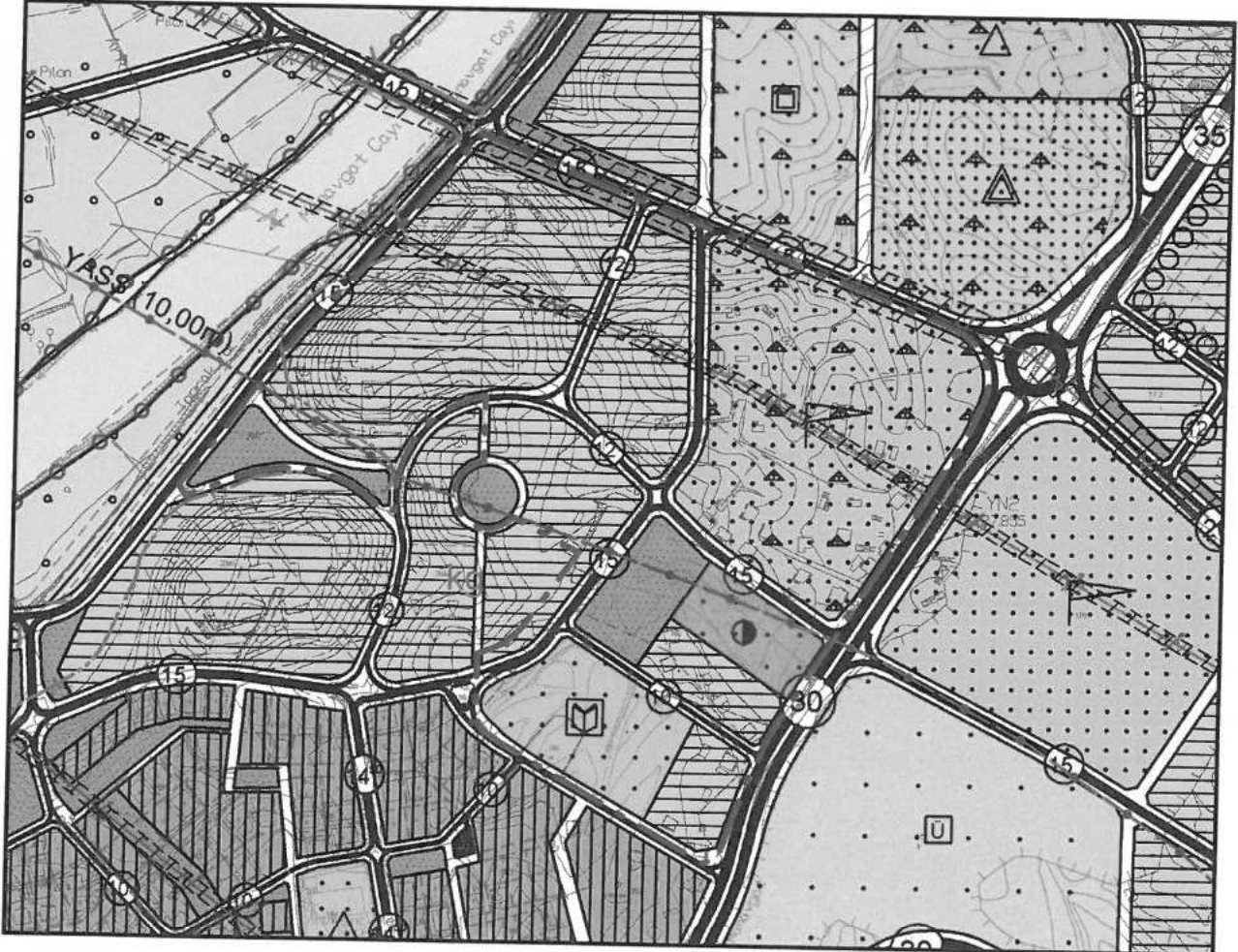
Şekil 2: Plan Değişikliğine Konu Alanın Meri 1/5000 Ölçekli İlave+Revizyon Nazım İmar Planındaki Yeri

Aynı zamanda plan değişikliğine konu alanın kuzey kısmı 04.03.2014 tarih 13 sayılı Meclis Kararı ile onaylı 1/5000 ölçekli "Manavgat (Antalya) Çeltikçi-Yenimahalle İlave+Revizyon Nazım İmar Planı" sınırları dahilinde kalmaktadır. Söz konusu ilave+revizyon nazım imar planında alanın kuzey bölgesinde yer alan gelişme konut alanları arasından geçen yaya+servis yolu kaldırılarak adalar birleştirilmiştir.